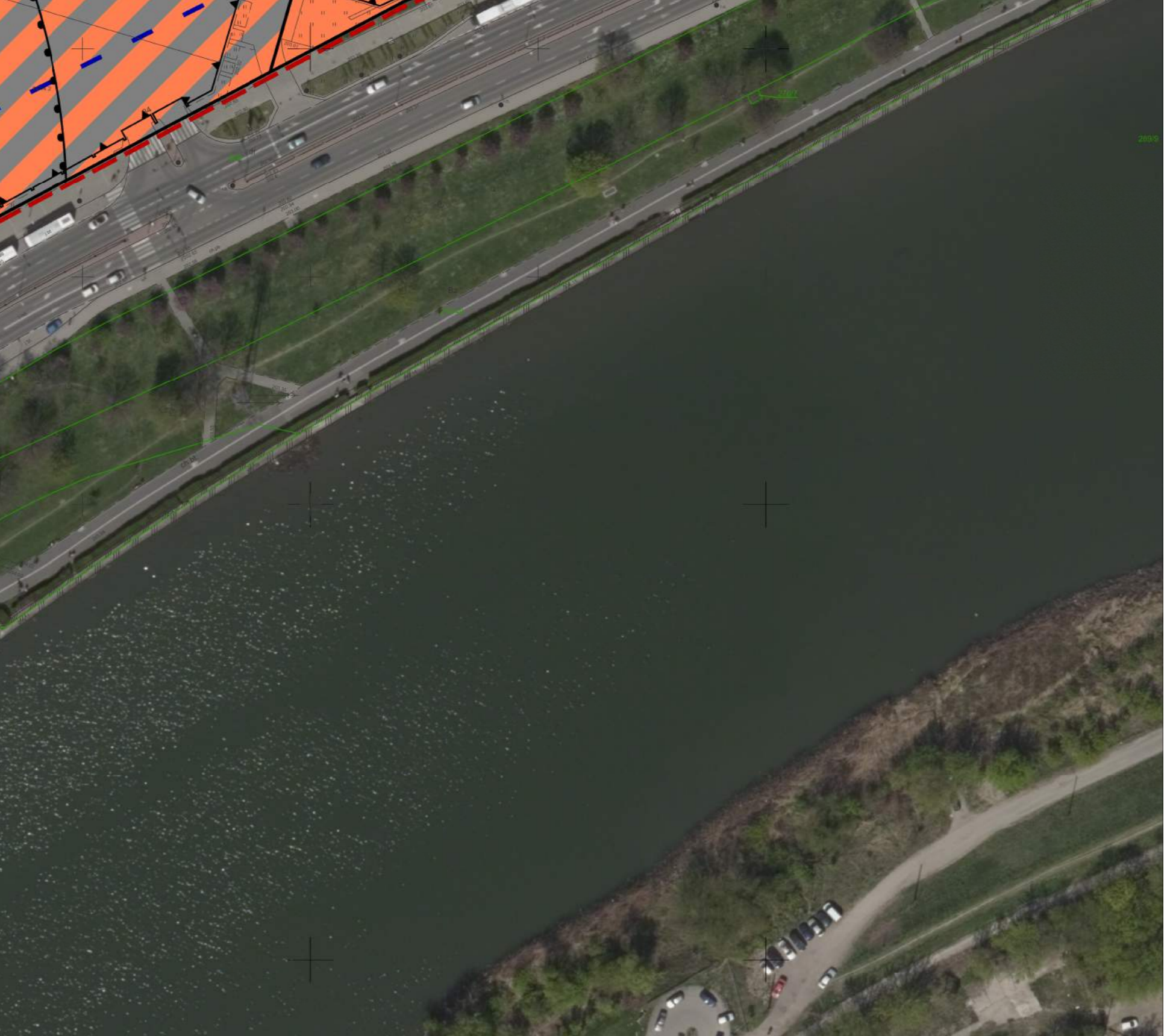
Wyrys ze Studium Uwarunkowań i Kierunków Zagospodarowania Przemysłowego Miasta Krakowa z zjednoczonego dokumentu Studium przyjętego 9 lipca 2014r. przez Radę Miasta Krakowa uchwałą Nr CVI/170/14