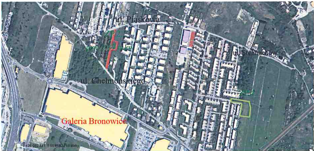
Miejscowy plan zagospodarowania przestrzennego „Bronowice Stelmachów”