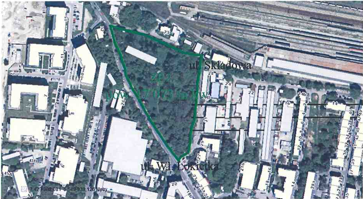
Miejscowy plan zagospodarowania przestrzennego „Łódź – Rejon ulic Łokietka i Wrocławskiej”