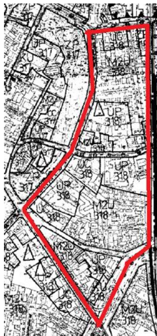
Przeznaczenia nieobowiązującego Miejscowego Planu Ogólnego Zagospodarowania Przestrzennego Miasta Krakowa

W planie ogólnym na większości obszaru występują przeznaczenia UP i UC tj. usług publicznych oraz usług komercyjnych, zgodnie z faktycznym użytkowaniem obiektów i terenów. Jako usługi publiczne wyznaczono np. tereny Straży Pożarnej czy Obiekty Szpitalne. Przeznaczenie pod usługi komercyjne otrzymały tereny fabryki Żółkiewskiego, Dom Turysty, czy obiekty przy ulicy Lubicz. Jedną dużą zmianę funkcjonalną można zauważyć obecnie dla obiektu Banku PKO zlokalizowanego przy ulicy Wielopole, który w planie z 1994 miał przeznaczenie Usług Publicznych, a obecnie jest przerabiany na komercyjny hotel.