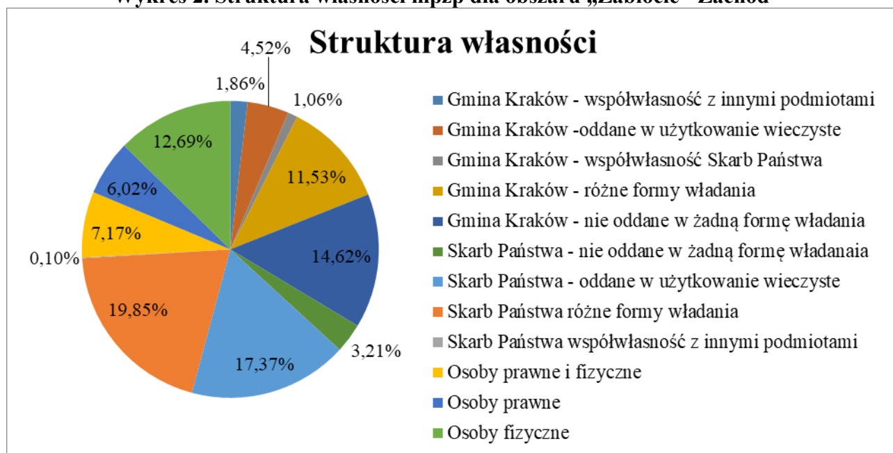
Wykres 2. Struktura własności mpzp dla obszaru „Zabłocie - Zachód”

Z przedstawionej analizy wynika, że pod względem własnościowym największy udział procentowy w ogólnej powierzchni objętej inwentaryzacją stanowią grunty będące własnością Skarbu Państwa. Około 20% to obszary oddane w różne w formy władania, natomiast około 17% - oddane w użytkowanie wieczyste. Działki będące we władaniu osób fizycznych stanowią niewiele ponad 3% powierzchni gruntów.