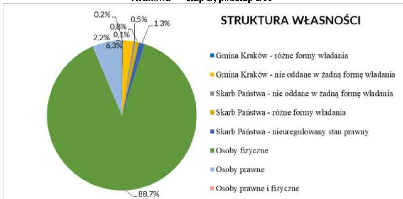
Wykres 3. Struktura własności mpzp „Dla wybranych obszarów przyrodniczych miasta Krakowa” – etap B, podetap B11