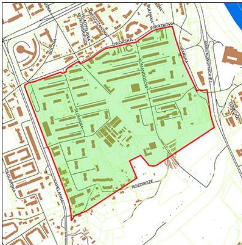
Rycina 1. Granica opracowania mpzp obszaru „Osiedle Podwawelskie”.