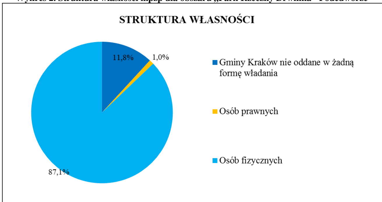
Wykres 2. Struktura własności mpzp dla obszaru „Park Rieczny Drwinka - Podedworze”

Na przedmiotowym obszarze przeważa własność osób fizycznych, stanowiąc 87,1 % powierzchni obszaru. W chwili obecnej jedynie 11,8 % obszaru stanowi własność Gminy Miejskiej Kraków.