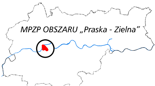
MPZP OBSZARU „Praska - Zielna”

ZAŁĄCZNIK GRAFICZNY do uchwały Nr CXXXI/3682/24 RADY MIASTA KRAKOWA z dnia 3 kwietnia 2024 r. — granice obszaru objętego miejscowym planem zagospodarowania przestrzennego obszaru „Praska - Zielna”