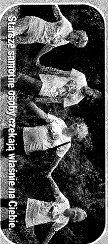
Starsze samotnie osoby czekają właśnie na Ciebie.

Celem Stowarzyszenia mali bracia Ubogich jest wspieranie starszych osób cierpiących z powodu samotności. mali bracia Ubogich to przyjaciele starszych ludzi.