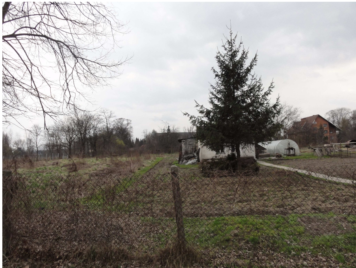
Fot. 5. Widok w kierunku klasztoru Cystersów z ul. Ptaszyckiego poprzez planowany teren U.13.1. (zdjęcie inwentaryzacyjne, BPP UMK).

„rozproszenia” zabudowy naniesione zostały linie nieprzekraczalne zabudowy zawężające obszarowo możliwości lokalizacji budynków. W terenie ZPo.13.2 zainwestowanie terenu będzie w przeważającej części obiektami powierzchniowymi, a więc nie powinny to być obiekty przysłaniające widok na bryłę zabytkowego klasztoru. Zaznacza się, że teren U.13.1 nie objęty jest wpisem do rejestru zabytków, dlatego zabezpieczenie wglądu widokowego w kierunku Opactwa Cystersów jest w tym terenie szczególnie istotne.