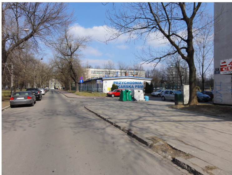
Fot. 3. Widok w głąb ul. Gardy-Godlewskiego, w planowanym terenie MWs.8.1, przy Parku Ratuszowym. Na zdjęciu widoczny parterowy budynek, z możliwością rozbudowy i nadbudowy do 19m wys. (zdjęcie inwentaryzacyjne, BPP UMK).