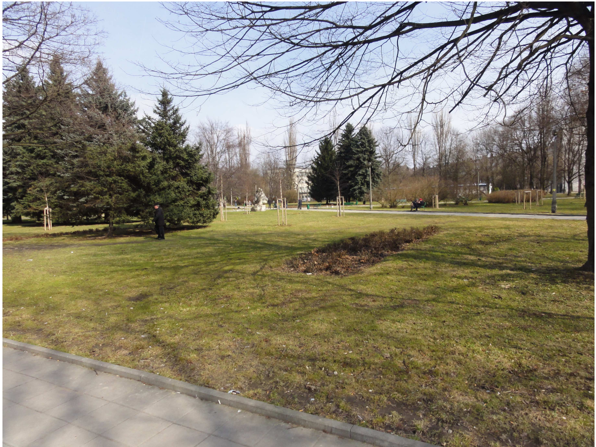
Fot. 2. Widok na Park Ratuszowy od strony Al. Róż. W głębi na prawo od grupy drzew iglastych, w miejscu istniejącego parterowego obiektu (widocznego za drzewami) może powstać nowy budynek mieszkalny o wysokości do 19m.