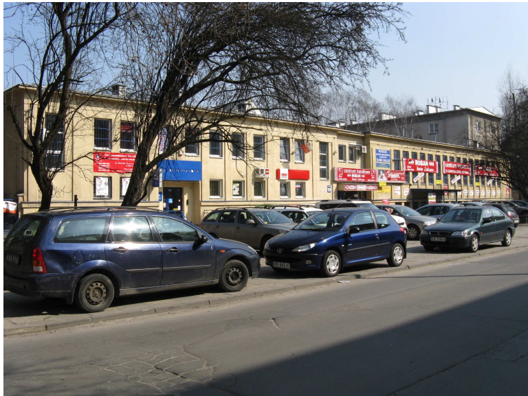
Fot.4. Istniejący budynek (teren MWn/U.4.3). Ustalona w planie maksymalna wysokość zabudowy – 18 m, umożliwi wybudowanie w tym miejscu obiektu 5-6 kondygnacyjnego (zdjęcie inwentaryzacyjne, BPP UMK).

Możliwe przekształcenia nie powinny zakłócić charakteru i specyfiki terenu, będą natomiast sprzyjać ochronie krajobrazu Starej Nowej Huty. Kontrowersyjna może być lokalizacja wysokiego budynku mieszkalno/usługowanego w eksponowanym miejscu przy Rondzie Czyżyńskim. Ze względu na wyjątkową ekspozycję wskazane jest, aby obiekt posiadał wysoką jakość architektury. W myśl nakazów ustalonych w projekcie planu (m.in.):