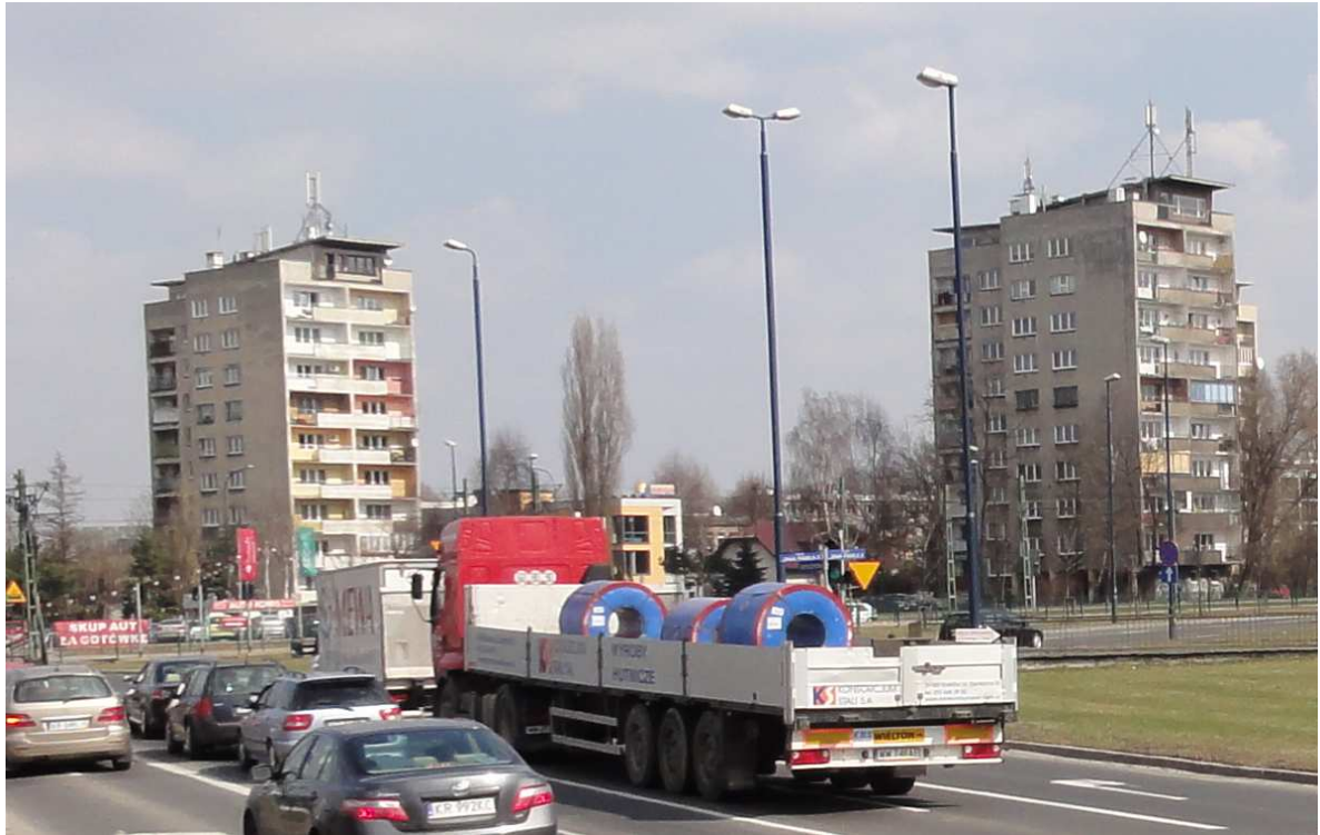
Fot.1. Widok w kierunku Os. Kolorowego od strony Ronda Czyżyńskiego. W przerwie pomiędzy dwoma dziesięciopiętrowymi budynkami widocznymi na zdjęciu może pojawić się nowy obiekt o podobnej wysokości (teren MWw/U.1.1) oraz niższe obiekty usługowe w terenie U.1.1..

historycznych. W kilku terenach będą mogły pojawić się nowe budynki, ale w krajobrazie zaznaczą się prawdopodobnie wyłącznie pojedyncze obiekty – przy Rondzie Czyżyńskim (MWw/U.1.1) (fot. 1), na osiedlu Teatralnym (MWn/U.4.3) oraz przy Parku Ratuszowym (MWs.8.1)(fot.2, 3). Zmiany znaczące w odniesieniu do stanu obecnego nastąpią również w terenach U.1.1, ZPo.13.1, możliwe, że również w terenie U.13.1 (fot.4).