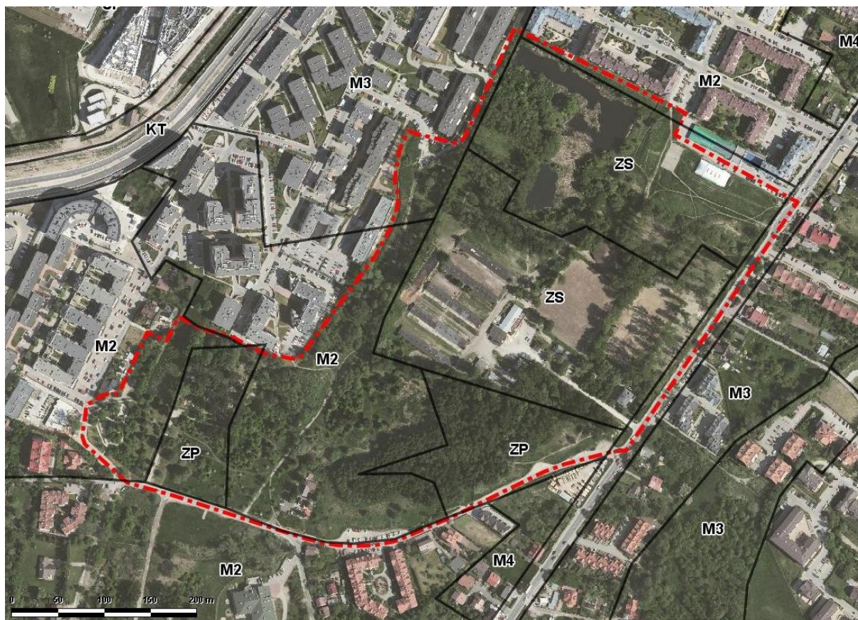
Ryc. 6. Przeznaczenia terenów w Miejscowym Planie Ogólnym Zagospodarowania Przestrzennego Miasta Krakowa z 1994 r