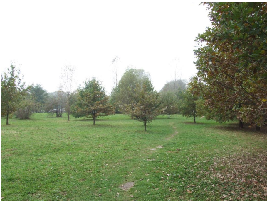
Fot. 1. Widok na teren pomiędzy cmentarzem a ulicą Lubostrzeń.