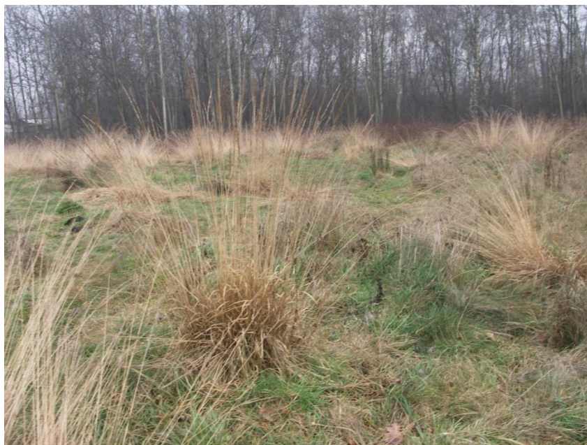
Fot. 3. Widok agrocenozy łąkowej, w tle zbiorowisko „drzewostany na siedliskach łągów”.