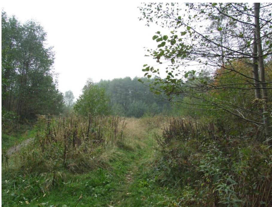
Fot. 2. Widok w kierunku południowym na wydzielenie „zarośla”.

Teren ten jest bardzo zróżnicowany (Fot. 2), obejmuje zbiorowiska terenów wydeptywanych, zarośla trzciny i nawłoci, zarośla podrostów drzew i krzewów, pojedyncze stare drzewa (olsze, wiązy), a także drzewostan o charakterze leśnym, złożony przede wszystkim z olszy czarnej.