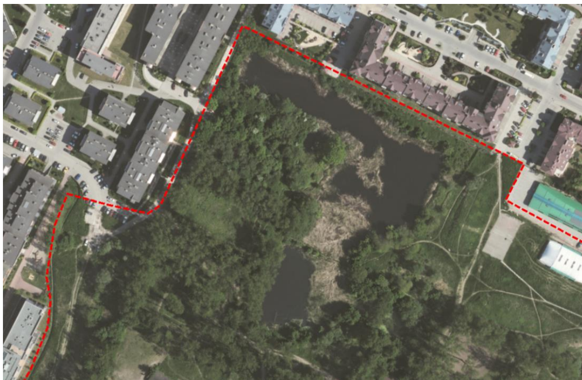
Ryc. 4. Fragment ortofotomapy z 2013 r.[44] z widocznymi stawami przy ul. Szuwarowej.

do ochrony tej szczególnie zagrożonej grupy zwierząt i ich siedlisk. W ramach inwentaryzacji w stawach przy ul. Szuwarowej stwierdzono trzy gatunki żab: ropucha szara Bufo bufo , żaba wodna Rana esculenta , żaba jeziorkowa Rana lessonae oraz dwa gatunki traszek – traszka grzebieniasta Triturus cristatus oraz traszka pospolita Triturus vulgaris . Stanowisko zostało określone, jako cenne, ponieważ tworzą go dwa zbiorniki, z których większy ma zatoczki, gdzie rozmnażają się płazy.