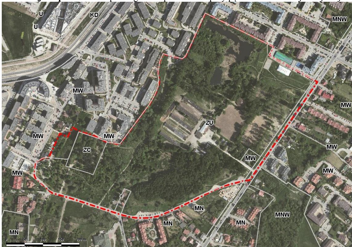
Ryc. 5. Przeznaczenia terenów w obowiązującym Studium Uwarunkowań i Kierunków Zagospodarowania Przestrzennego Miasta Krakowa na tle ortofotomapy z naniesionymi granicami projektu planu..

Funkcja dopuszczalna - parkingi wielopoziomowe przy pętlach komunikacji miejskiej.