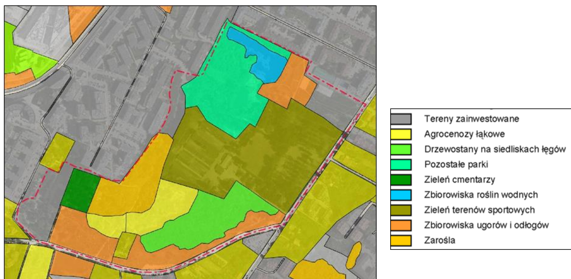
Ryc. 3. Fragment mapy roślinności rejonu obszaru objętego projektem planu (na podst. [37])

Obszar opracowania w większości stanowią tereny zielone. W opracowaniu „ Mapa roślinności rzeczywistej... ” [37] wydzielono w nim kilka typów zbiorowisk roślinnych (Ryc. 3). Zaznacza się, że „ Mapa... ” została w skali 1:10 000, w latach 2006-2007. Ze względu na skalę mapy oraz upływ czasu może występować niespójność z obecnym stanem roślinności, co uwzględniono poniżej. W ramach prac nad „ Mapą roślinności rzeczywistej ” w obszarze opracowania zostały wykonane trzy zdjęcia fitosocjologiczne, które przytoczono poniżej – lokalizację zdjęć przedstawiono na rysunku ekofizjografii.