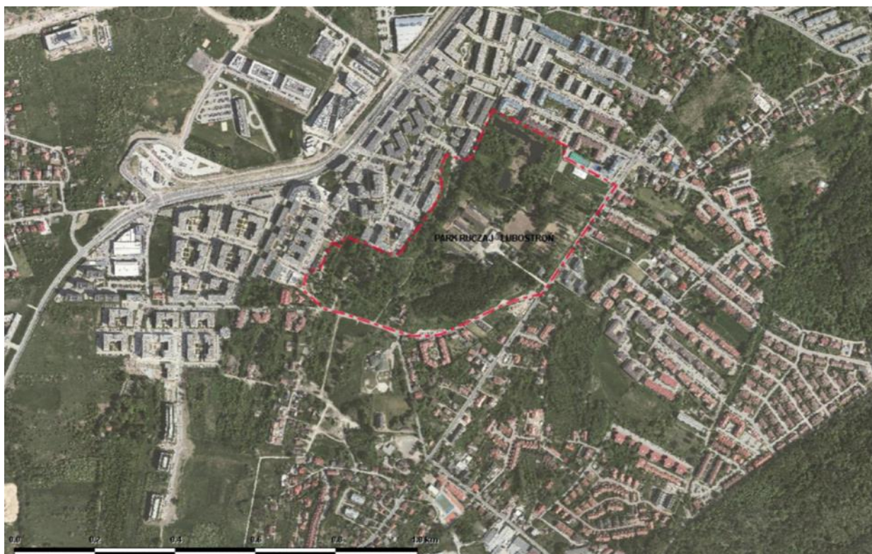
Ryc. 1. Położenie obszaru planu „Park Ruczaj-Lubostroj” na tle terenów sąsiednich.