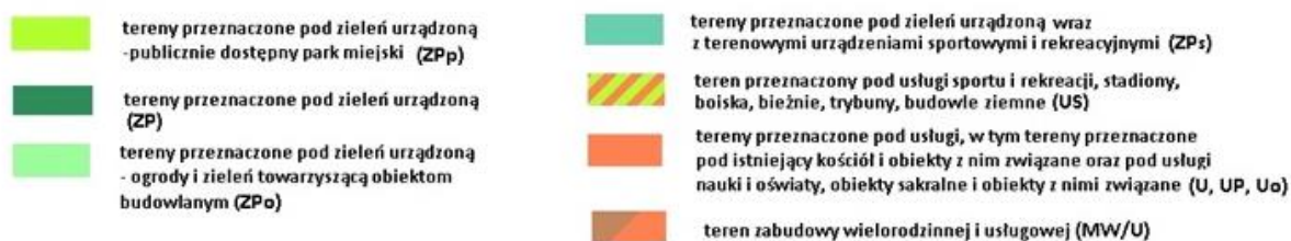
Ryc. 3. Przeznaczenia terenów w obowiązującym planie zagospodarowania przestrzennego obszaru „Młynówka Królewska-Grottgera” z zaznaczeniem granicy sporządzanego planu „Młynówka Królewska-Grottgera II”.