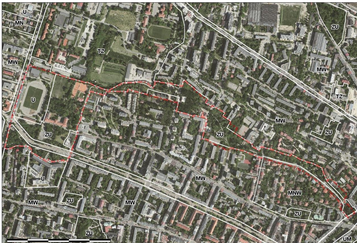
Ryc. 2. Przeznaczenia terenów w obowiązującym Studium Uwarunkowań i Kierunków Zagospodarowania Przestrzennego Miasta Krakowa na tle ortofotomapy z naniesionymi granicami projektu planu.

Studium przewiduje następujące kierunki zmian w strukturze przestrzennej dla analizowanego obszaru: