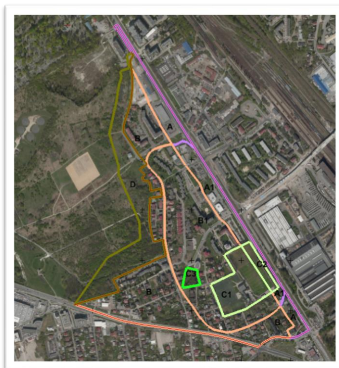
Rys. 2 Kompleksy funkcjonalno-przestrzenne (10) na tle ortofotomapy wykonanej na podstawie zdjęć lotniczych wykonanych w 2015 r.