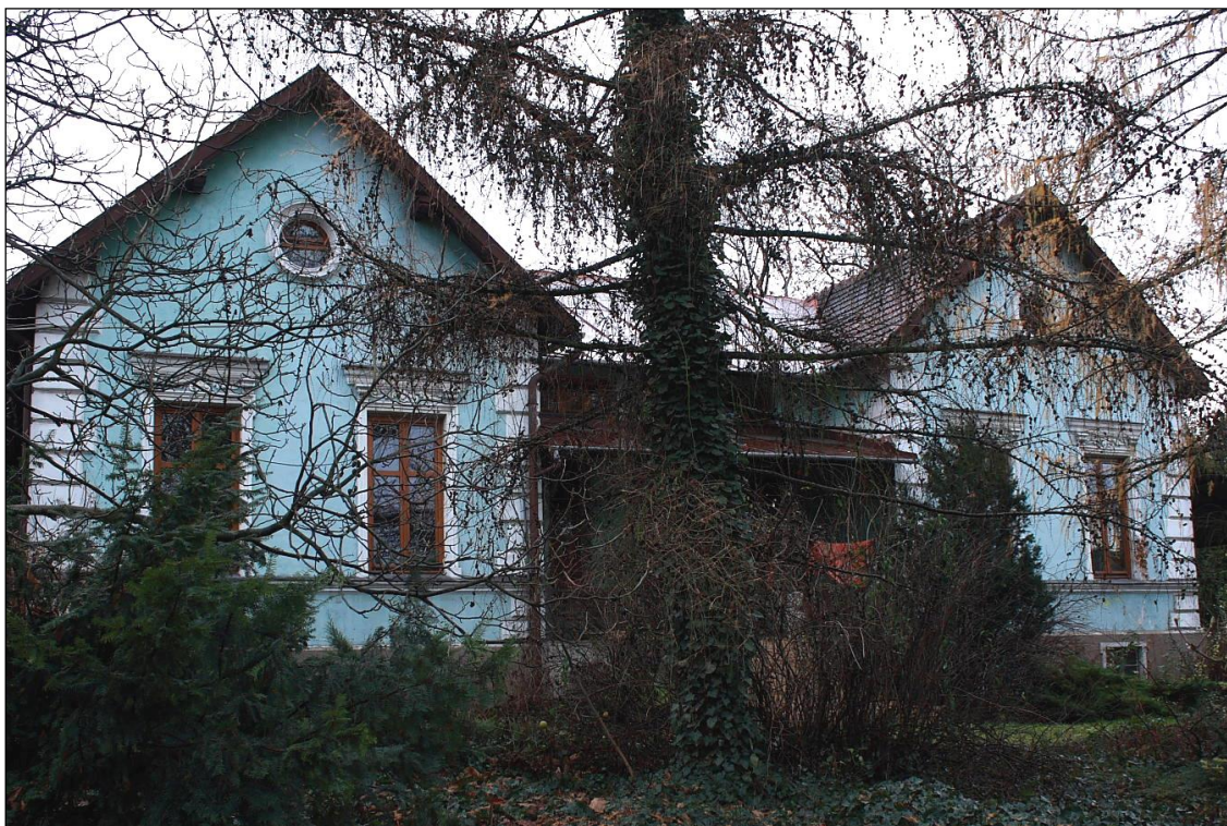
Fot. 2 Zabytkowa willa w otoczeniu ogrodowym przy ul. Wielickiej 115 (widok od wschodu, W. Sroczyński) (10)

Zgodnie z Ustawą z dnia 23 lipca 2003 r. o ochronie zabytków i opiece nad zabytkami przy sporządzaniu miejscowych planów zagospodarowania przestrzennego uwzględnia się ochronę zabytków i opiekę nad zabytkami. W szczególności: