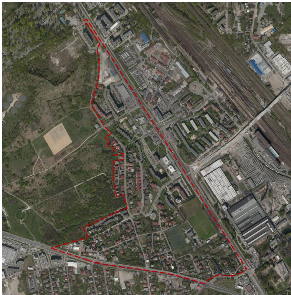
Rys. 1 Położenie obszaru mpzp „Wielicka – Kamińskiego” na tle ortofotomapy wykonanej na podstawie zdjęć lotniczych wykonanych w 2015 r.

Teren miejscowego planu zagospodarowania przestrzennego obszaru "Wielicka-Kamińskiego" o powierzchni 40,5 ha położony jest w południowej części Krakowa w dzielnicy XIII Podgórze. Zawiera się w "klinie" terenu pomiędzy ulicami: Wielicką, Kamińskiego i Malborską (od północnego wschodu, wschodu i południa), a terenami byłego obozu KL Płaszów 1 na zachodzie. Ta ostatnie granica (od W, SW i NW) przebiega wzdłuż (lub w pobliżu) ulic: Jerozolimska, Heltmana, Lecha, Siemomysła, Stoigniewa. Teren opracowania jest w przeważającej części zainwestowany.