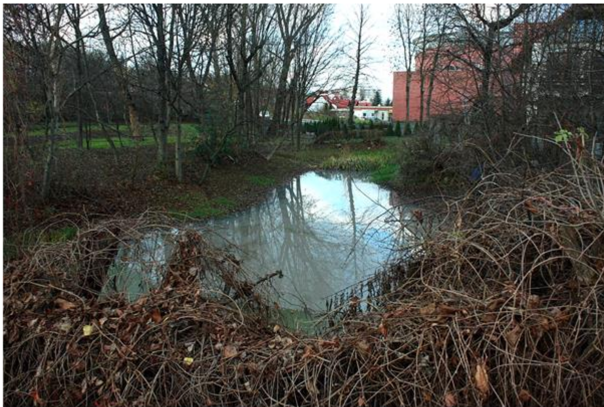
Fot. 1 Oczko wodne przy ul. Pańskiej (widok od ul. Pańskiej, W. Sroczyński) (10)

Przy ul. Pańskiej, blisko skrzyżowania z ul. Gipsową, w bezodpływowym zagłębieniu, zachowały się małe oczka wodne, w otoczeniu zieleni. Zasilanie odbywa się przez opady, a także z wylotu drogowej kanalizacji deszczowej. Akwen jest płytki i mocno zanieczyszczony.