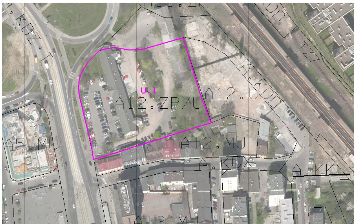
Ryc. 2. Położenie obszaru planu „Skład Solny” na tle obowiązującego planu „Zabłocie”.