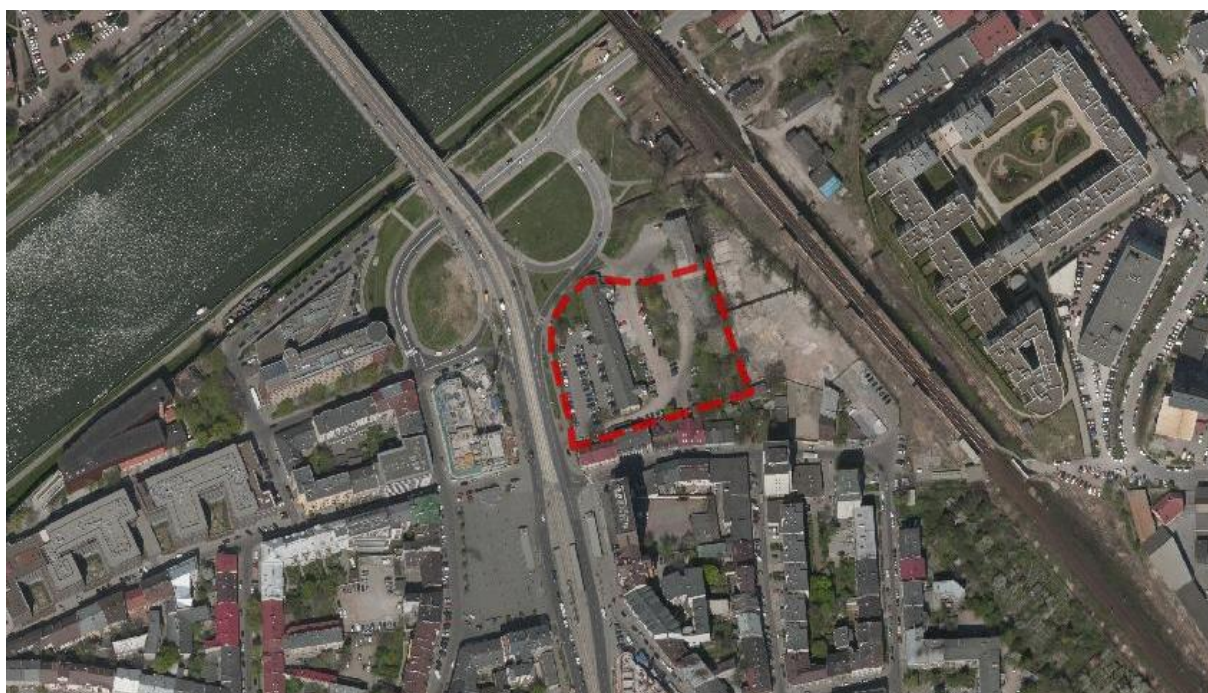
Ryc. 1. Położenie obszaru projektu planu na tle terenów sąsiednich.