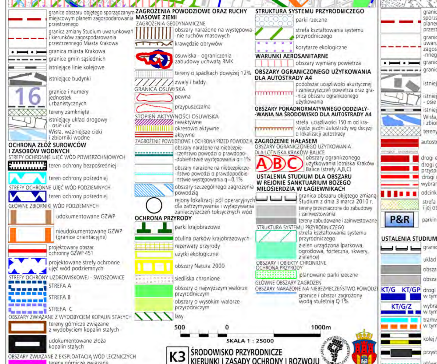
Wzrys ze Studium Uwarunkowań i Kierunków Zagospodarowania Przemysłowego Miasta Krakowa z ujednoliconego dokumentu Studium przyjętego 9 lipca 2014r. przez Radę Miasta Krakowa uchwałą Nr CXIII/1700/14