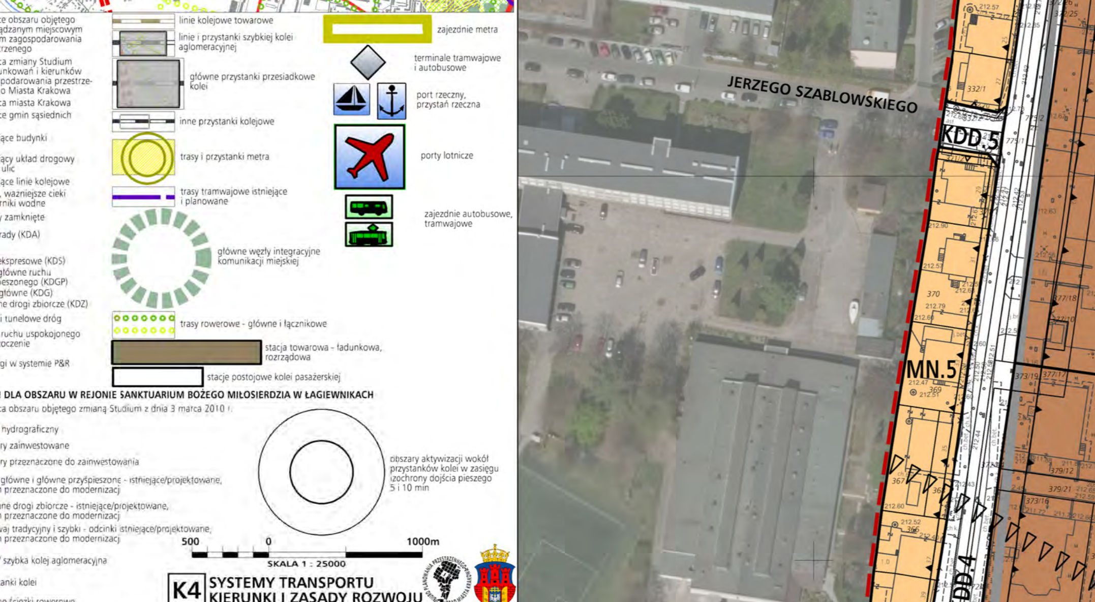
Wzrys ze Studium Uwarunkowań i Kierunków Zagospodarowania Przemysłowego Miasta Krakowa z ujednoliconego dokumentu Studium przyjętego 9 lipca 2014r. przez Radę Miasta Krakowa uchwałą Nr CXIII/1700/14