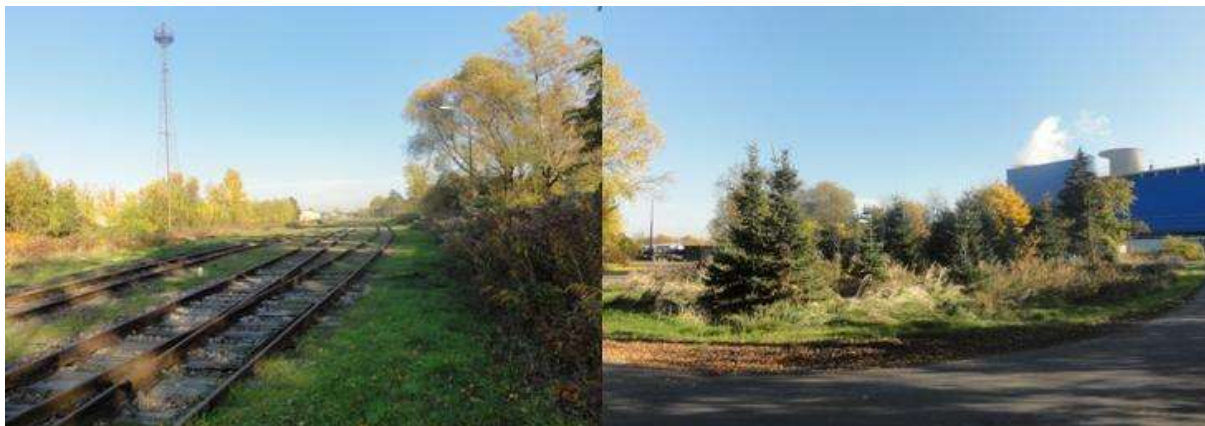
Fot. 1. Zieleń w południowej części obszaru.