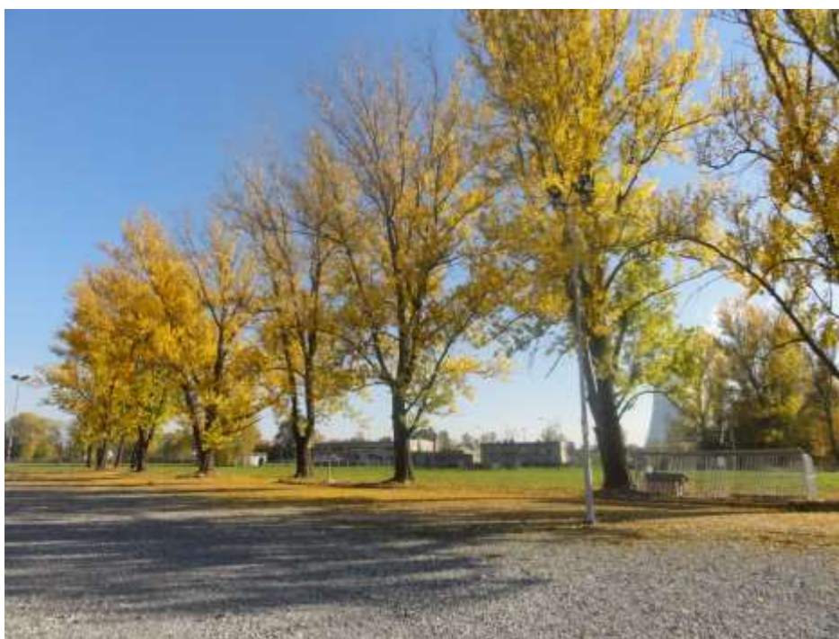
Fot. 2. Wyróżniający się szpaler topoli (zlokalizowany na południe od centrum targowo-kongresowego).