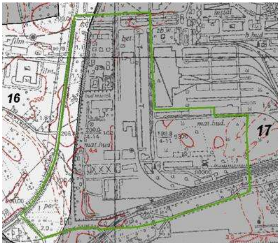
Ryc. 2. Jednostki glebowe i ich rozmieszczenie na analizowanym obszarze (16 – tereny zabudowane oraz gleby urbanoziemne i gleby ogrodowe; 17 – gleby zmienione przez przemysł) [17].