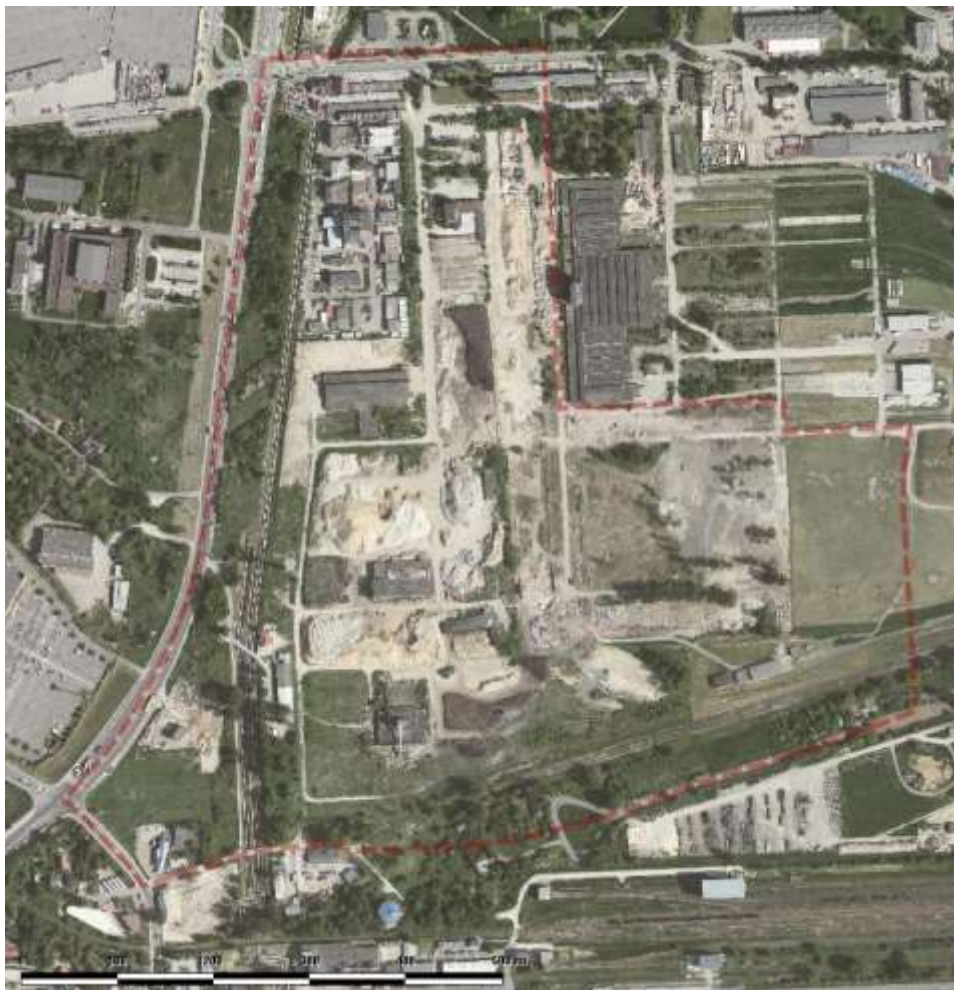
Ryc. 1. Położenie obszaru opracowania na tle terenów sąsiednich (stan na 2013 r. [21]).

Większość obszaru znajduje się w zasięgu obowiązującego miejscowego planu zagospodarowania przestrzennego „Czyżyny – Łęg”, który obowiązuje od dnia 13 października 2013 r.