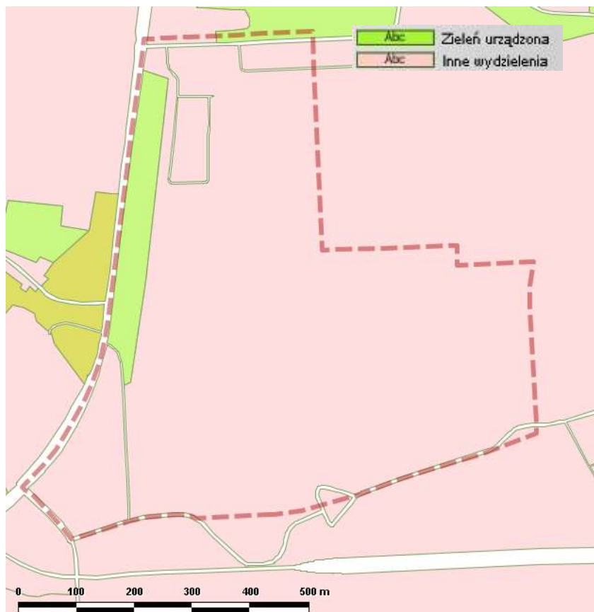
Ryc. 3 Roślinność rzeczywista obszaru „Czyżyny – Rejon ulicy Galicyjskiej” [15]

Większość obszaru „Czyżyny – Rejon ulicy Galicyjskiej” stanowią tereny zainwestowane (zgodnie z przedstawionym fragmentem „Mapy roślinności rzeczywistej”). W niewielkim stopniu na omawianym obszarze występuje zieleń urządzona. Poniżej przedstawiono krótką charakterystyką wydzielonych zbiorowisk roślinności rzeczywistej.