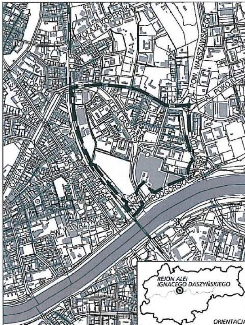
Rys. Nr 1. Granice miejscowego planu zagospodarowania przestrzennego obszaru „Rejon Alei Ignacego Daszyńskiego” na tle najbliższych położonych terenów sąsiednich