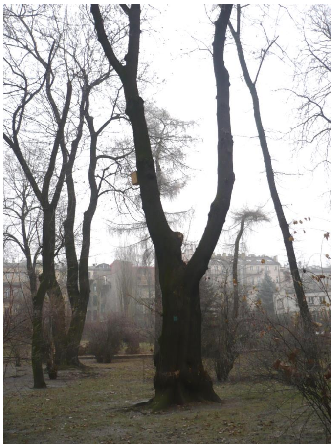
Fot. 5. Pomnik przyrody – klon w ogrodzie Zgromadzenia Księża Misjonarzy.