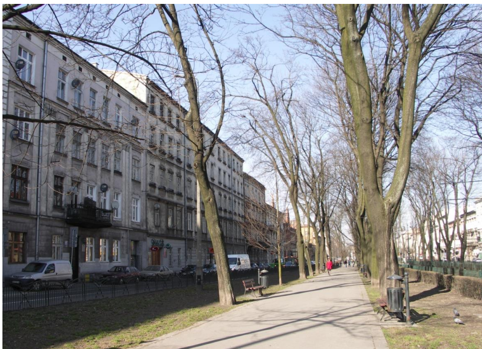
Fot. 4. Widok zieleni urządzonej w ciągu ul. Dietla.

Obszar opracowania obejmuje część pasa zieleni w ciągu ul. Dietla. W części od skrzyżowania z ul. Stradomską do skrzyżowania z ul. Dietla rosną regularne szpalery drzew (w dużej części klonów), a zieleniec wyposażony jest w asfaltową aleję, ławki, kosze na śmieci. W części od skrzyżowania z ul. Stradomską w kierunku Ronda Grunwaldzkiego rosną pojedyncze starsze drzewa oraz grupy krzewów, ponadto w ostatnim czasie posadzono regularny szpaler drzew od strony krawędzi jezdni, brak jest infrastruktury dla pieszych.