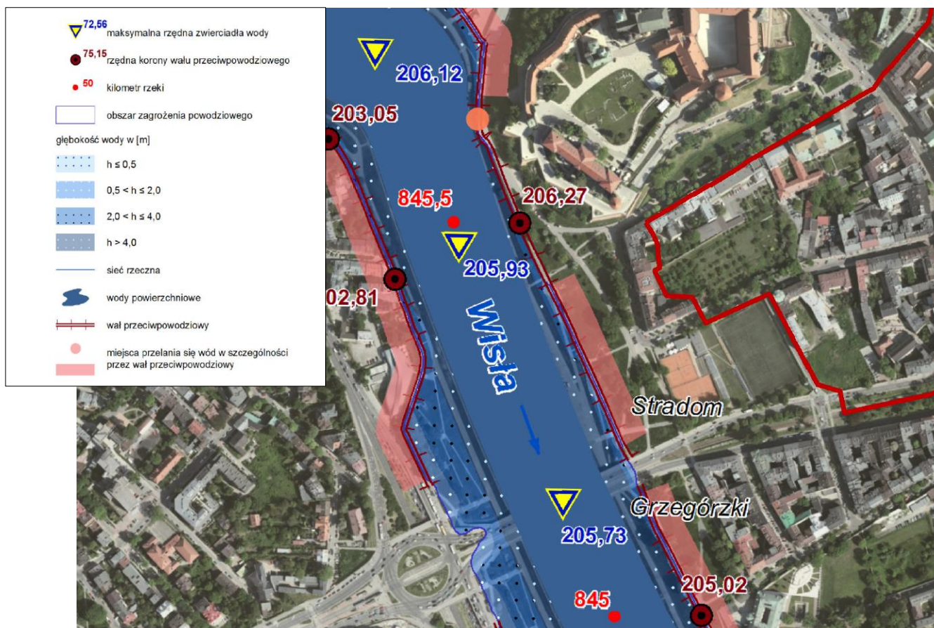
Ryc. 2. Fragment Mapy zagrożenia powodziowego wraz głębokością wody – miejsca przelania się wód przez wał przeciwpowodziowy oraz obszary, na których prawdopodobieństwo wystąpienia powodzi jest niskie i wynosi raz na 500 lat [32].

Z kolei w przypadku zniszczenia lub uszkodzenia wału przeciwpowodziowego (zasięg powodzi, przy wyznaczeniu którego przyjęto przepływ o średnim prawdopodobieństwie wystąpienia powodzi wynoszącym raz na sto lat (Q1%)) na zalanie narażona jest większość analizowanego obszaru poza północnym fragmentem terenu (rejon: ul. św. Gertrudy/ul. Starowiślna), a także niewielkimi powierzchniami przy północnym odcinku ul. Stradomskiej oraz przy ul. Bernardyńskiej. Prawdopodobne głębokości zalania wynoszą do 4 m, przy czym w większości wahają się w granicach od 0,5 do 2 m [32] (Ryc. 3).