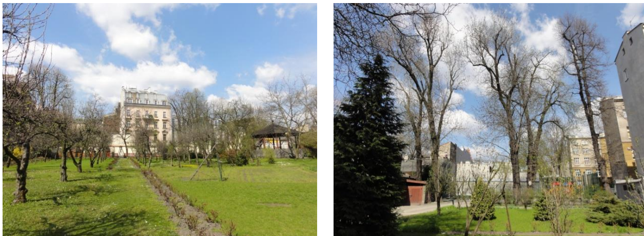
Fot. 3. Widok ogrodu Sióstr Urszulanek.