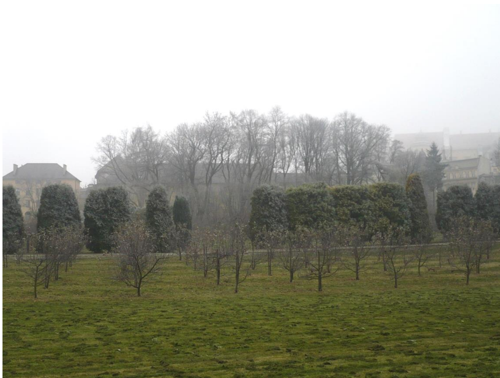
Fot. 1. Fragment ogrodu Misjonarzy z widoczną grupą starych drzew (wraz z pomnikiem przyrody).