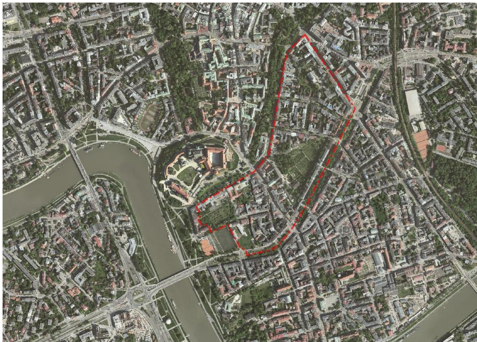
Ryc. 1. Położenie obszaru projektu planu na tle terenów sąsiednich.

Przedmiotowy obszar ograniczony jest ulicami: Dietla, Starowiślną oraz Św. Gertrudy, a od zachodu granicą obowiązującego miejscowego planu zagospodarowania przestrzennego „Bulwary Wisły”. Powierzchnia obszaru wynosi 27,8 ha.