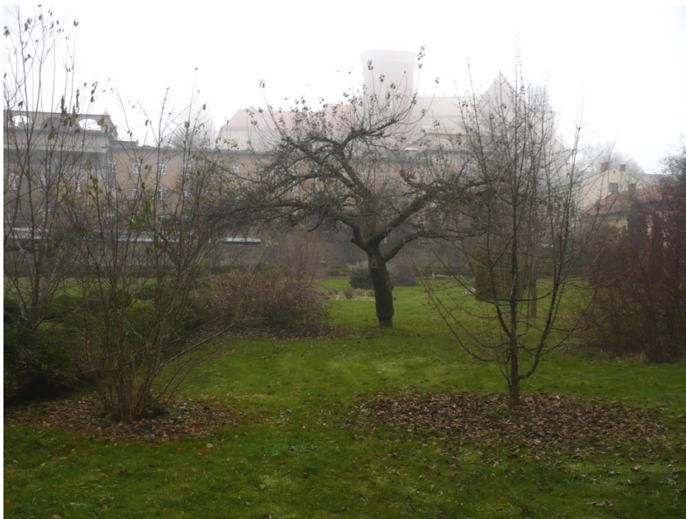
Fot. 2. Fragment ogrodu Bernardynów z widokiem na Wawel.