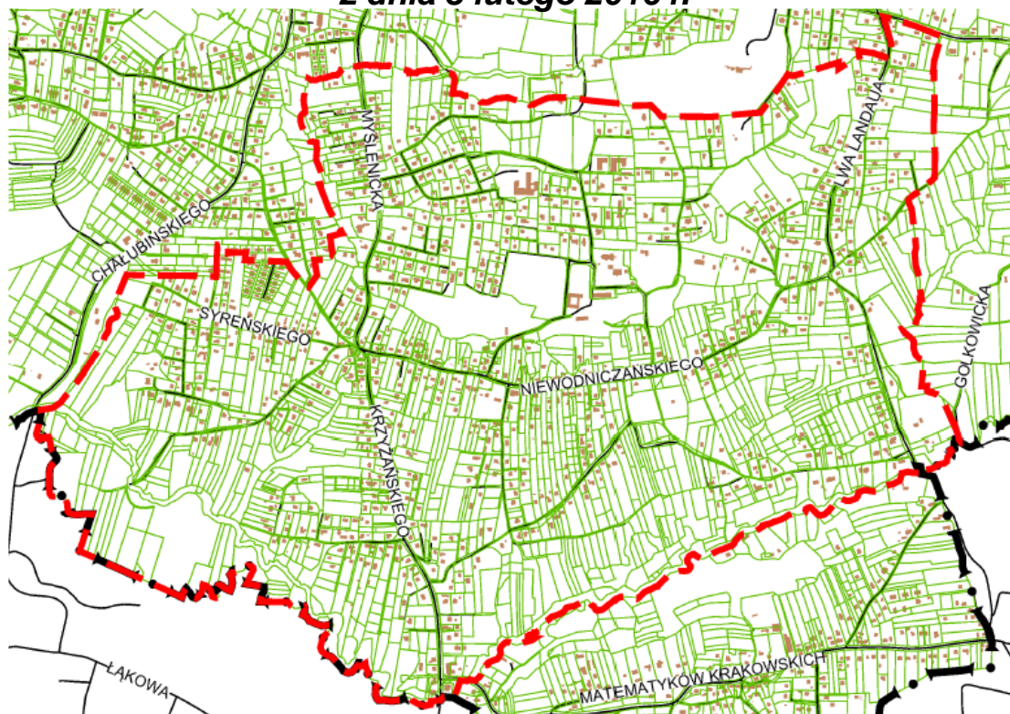
GRANICA PLANU – zgodnie z załącznikiem graficznym do Uchwały Rady Miasta Krakowa o przystąpieniu do sporządzania planu

Uchwała nr CVIII/2931/23 Rady Miasta Krakowa z dnia 5 kwietnia 2023 r. zmieniająca uchwałę nr XXXVI/615/16 z dnia 3 lutego 2016 r. w sprawie przystąpienia do sporządzanego miejscowego planu zagospodarowania przestrzennego obszaru „Wróblowice II”