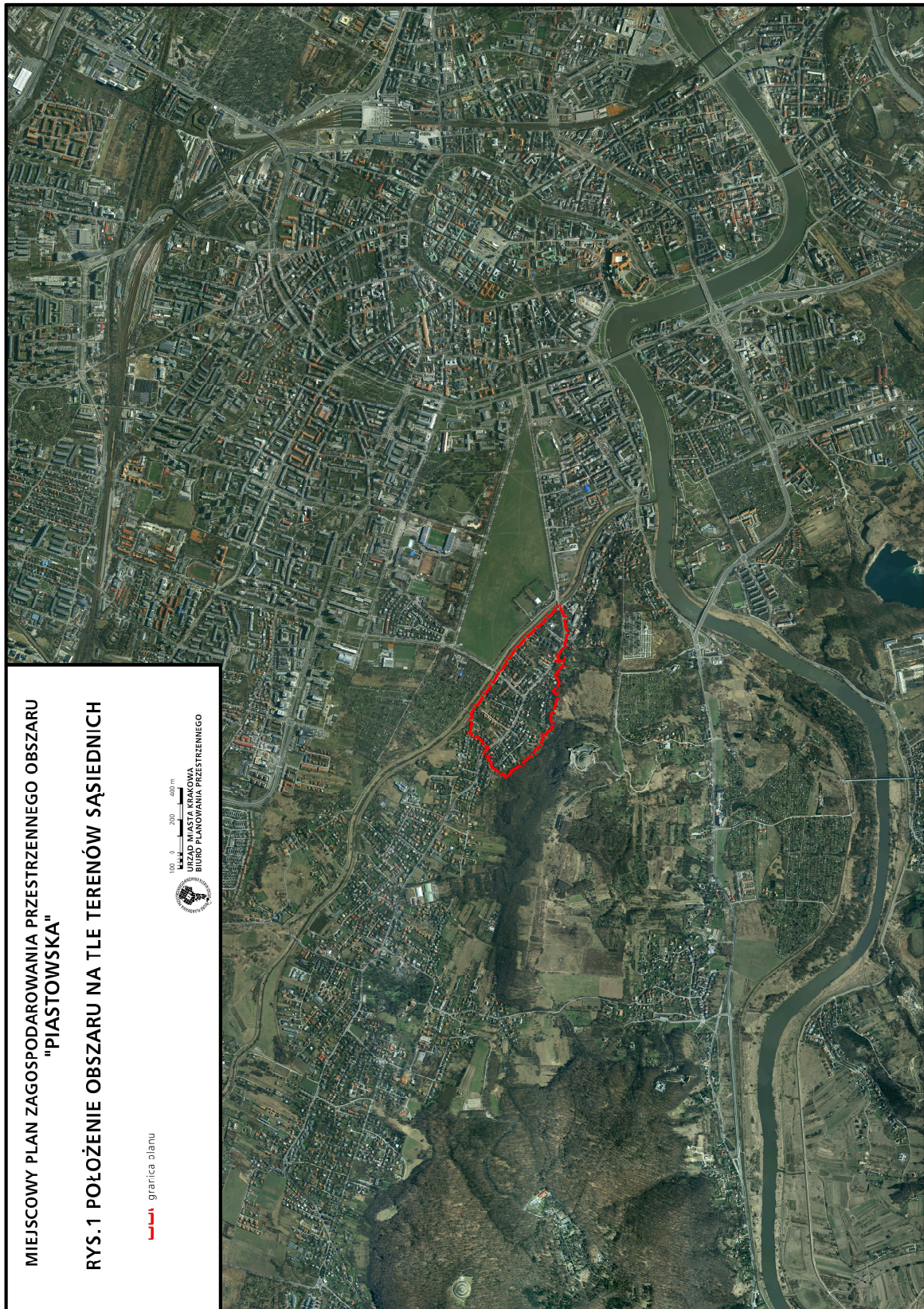
MIEJSCOWY PLAN ZAGOSPODAROWANIA PRZESTRZENNEGO OBSZARU "PIASTOWSKA"