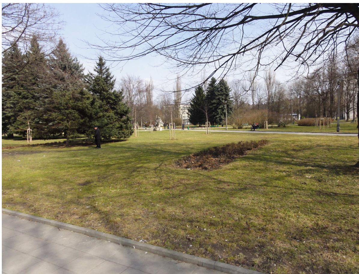
Fot. 2. Widok na Park Ratuszowy od strony Al. Róż. W głębi na prawo od grupy drzew iglastych, w miejscu istniejącego parterowego obiektu (widocznego za drzewami) może powstać nowy budynek mieszkalny o wysokości do 19m.