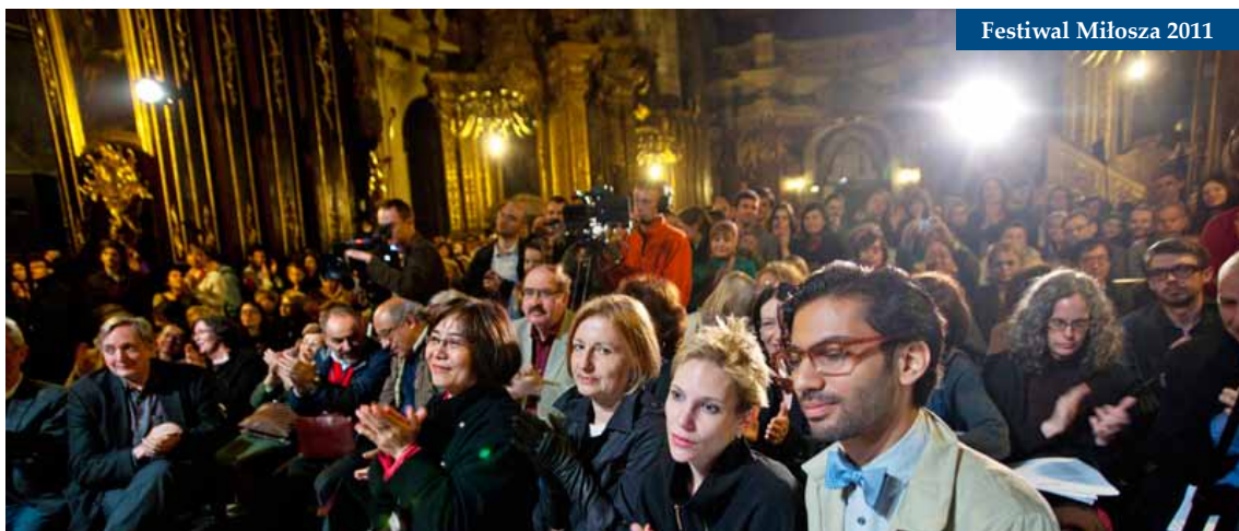
Festiwal Miłosa 2011