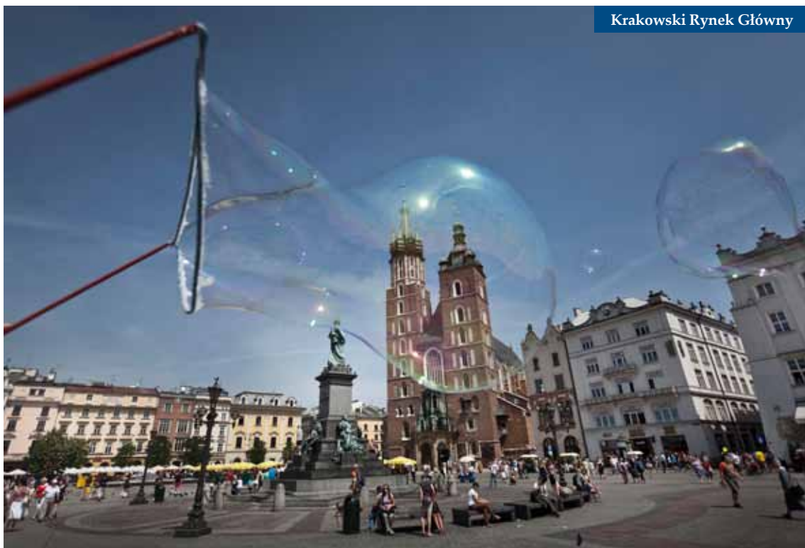
Krakowski Rynek Główny