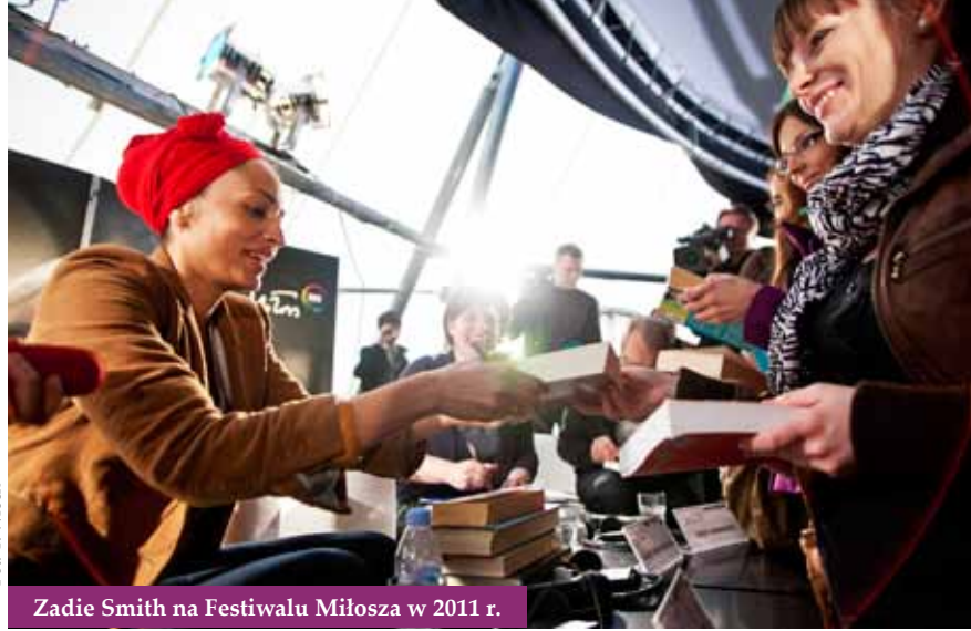
Zadie Smith na Festiwalu Miłosza w 2011 r.