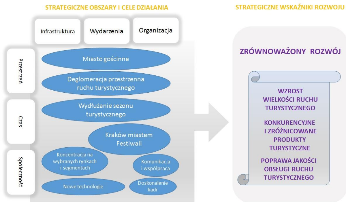
Rys. 2. Strategiczne cele i obszary rozwoju turystyki w Krakowie w latach 2014-2020.

Na poniższym rysunku (nr 2) zaprezentowano w sposób syntetyczny cele i obszary rozwoju turystyki w Krakowie na lata 2014-2020.