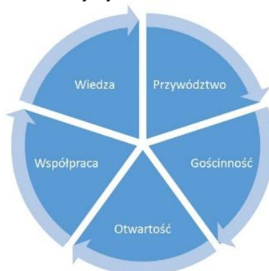
Rys. 3. Filary MISJI Krakowa w zakresie turystyki.

MISJA władz lokalnych Krakowa w obszarze rozwijania turystyki opiera się na następujących filarach (rys. 3):