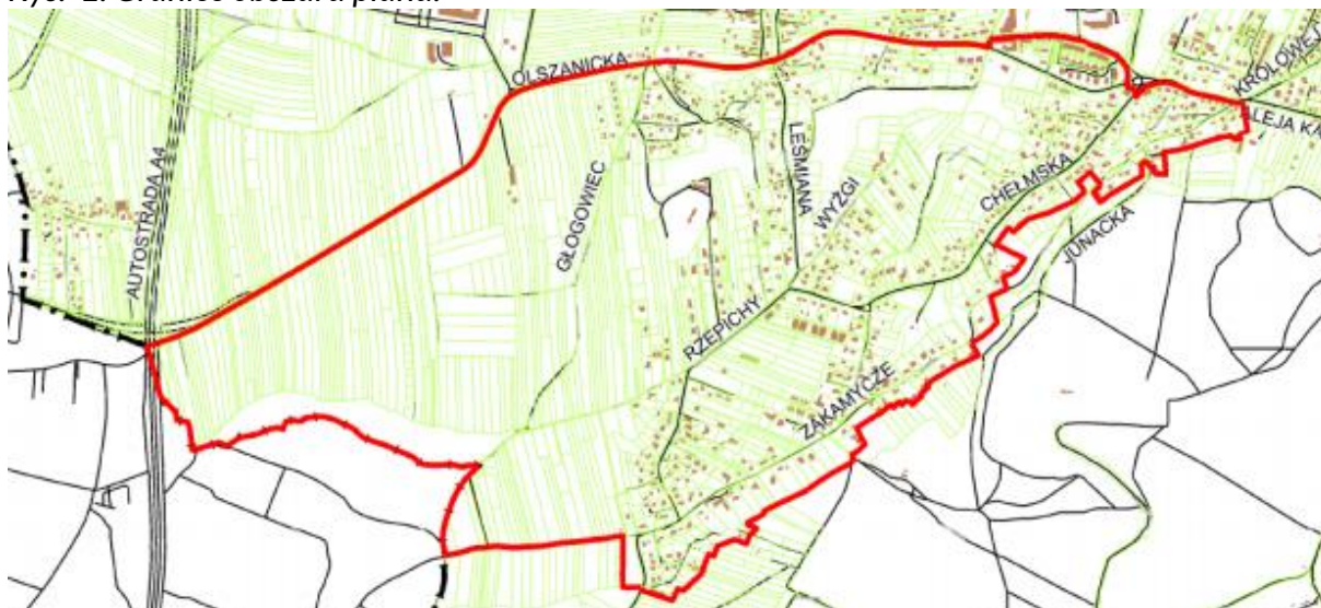
Rys. 1. Granice obszaru planu.

Powierzchnia obszaru objętego planem wynosi 235,4 ha.