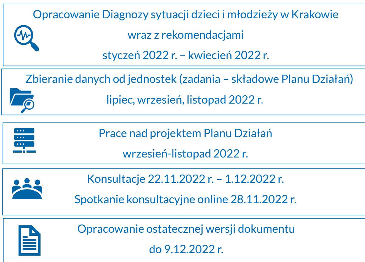
Grafika 1. Harmonogram prac nad Planem Działań

Dokument uwzględnia także wnioski i uwagi z konsultacji społecznych, które przeprowadzono w terminie 22.11.2022 r. - 1.12.2022 r. z podmiotami wskazanymi przez Urząd Miasta Krakowa: lokalnymi organizacjami pozarządowymi działającymi na rzecz dzieci i młodzieży, Młodzieżową Radą Krakowa, Komisją Dialogu Obywatelskiego ds. Młodzieży oraz instytucjami pomocowymi (np. MOPS w Krakowie). W ramach konsultacji zrealizowano spotkanie online, które odbyło się 28 listopada 2022 r. w godzinach 10.00 - 12.00 za pomocą platformy Zoom. Celem spotkania było przedstawienie struktury Planu Działań oraz dyskusja wokół głównych założeń dokumentu, m.in. w kontekście potrzeb i rekomendacji określonych w Diagnozie. W spotkaniu uczestniczyło 9 osób. W okresie trwania konsultacji uwagi do wstępnej wersji dokumentu zbierano również w formie elektronicznej, m.in. poprzez formularz online.